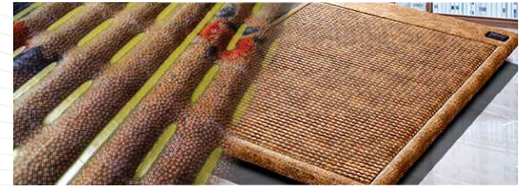
겔라이트 바이오볼 매트