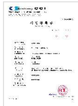
국산 원산지 증명서