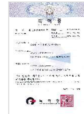
짚질방 에어하우스 특허증