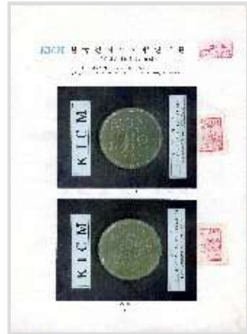
KICM 항균 시험