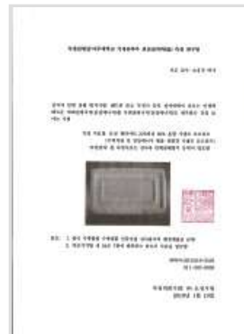
전자파 차단 실험